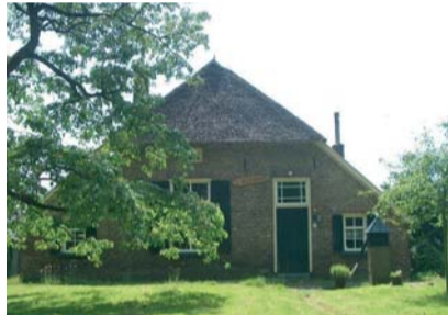
't Hofhuis