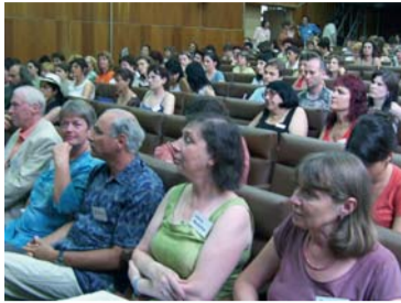
drukbezochte conferentie

In Bulgarije wordt veel gedaan om de kwaliteit van de veel te grote en verouderde inrichtingen te verbeteren. Vele daarvan moeten per januari 2007 sluiten en er worden nieuwe oplossingen gezocht voor weeskinderen, kinderen en volwassenen met lichamelijke en verstandelijke handicaps en psychiatrische problematiek. Nieuwe NGO's nemen deze uitdaging aan en bouwen samen met gemeentes nieuwe sociale instellingen op, zoals dagcentra, begeleid wonen, thuiszorg etc. De integratie van mensen met een handicap in onderwijs, arbeid en maatschappij is echt begonnen! Vanuit het buitenland wordt deze ontwikkeling met geld en expertise ondersteund en er is - na enkele pilotprojecten - nu ook wetgeving ontwikkeld, maar het is nog maar een begin! Pedagogen, sociaal werkers, therapeuten en groepsleiders etc. realiseren zich dat er nog veel op het gebied van opleiding moet gebeuren. Daarom is er in het algemeen veel openheid m.b.t. het uitwisselen van ervaringen, nieuwe kennis en methodieken, zoals bijvoorbeeld kunstzinnige therapie. Er is openheid ten opzichte van een ander mensbeeld en de spirituele kant van het leven is geen taboe meer, zoals bleek tijdens de eerste conferentie over heilpedagogie en sociaaltherapie in Varna - aan de Zwarte Zeekust - van 28 tot en met 30 juli j.l. met als thema: 'Mensen met mogelijkheden: denken, voelen en handelen'.