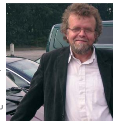
Heilpedagogie is ook topsport, je moet het als prikkel, als uitdaging zien.

BH: Ik vertelde je over heilpedagogie in Roemenië, waar een actieve relatie met de orthodoxe kerk is ontstaan. Heilpedagogie in de religieuze context van het eigen land. Hoe zie jij dat? De imam in een heilpedagogische instelling in Egypte?