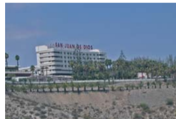
een groot wit gebouw op een berg

Men ziet dat de muziektherapie werkt en dat het een nieuwe kwaliteit toevoegt aan het centrum. Ik was blij en dankbaar met deze evaluatie, en enthousiast maakten we verdere plannen voor het nieuwe seizoen: mijn taak hier is nog niet klaar. Het is de bedoeling dat de muziektherapie zal integreren in het instituut, en dat ik iemand in het vak ga opleiden, opdat zij in de toekomst mijn werk zal kunnen voortzetten.