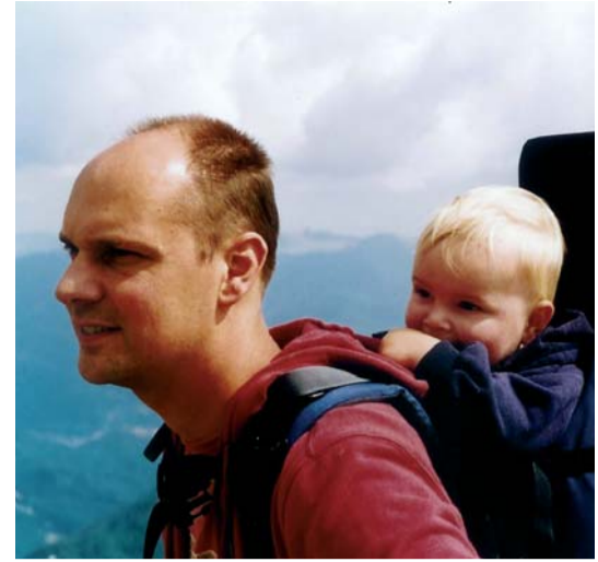
"Wetgeving is een neerslag van het bewustzijn van onze tijdgenoten"