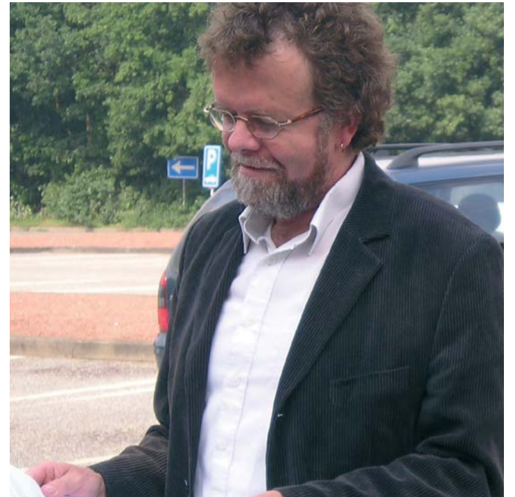
'Willen mensen met heilpedagogie kunnen werken, dan moeten ze er door geraakt worden.'

Je gaat het herkennen aan dat het een organisatie wordt die sterke begrippen hanteert, inhoudelijke uitgangspunten nadrukkelijk waarborgt. Het wordt een organisatie met medewerkers die voor zichzelf nogal ambitieus zijn. Die ook iets willen doen in de vorm die ik zojuist zei. Die echt voor hun verantwoordelijkheid staan. Dat zijn twee belangrijke peilers. Ik denk dat het ook een organisatie wordt met de nodige lef. Past ook wel een beetje bij mij, geloof ik. ◀