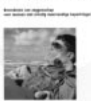
Een andere werkelijkheid

"Het beeld dat je hebt van mensen met ernstig meervoudige beperkingen wordt gekleurd door alles wat je weet en eerder ervaren hebt..... Hoe je je gedraagt naar de persoon hangt af van hoe je naar hem of haar kijkt." Bij Dialoog wordt bewustzijn en terughoudendheid gevraagd: "De houding die gevraagd wordt is er één van respect voor de persoon, de mogelijkheid open houden dat hij of zij ergens een mening over kan hebben, al weet je niet zeker of deze ook kenbaar kan worden gemaakt. Een uitnodigende, volgende houding hierin, waarbij je je eigen mening kent en je ervan bewust bent dat je daar bescheiden mee omgaat." En: "Waar ouders van hun kind geleerd hebben de signalen te zien en te vertalen, kunnen zij dit aan begeleiders leren als ze zich willen openstellen en geduld hebben om te wachten."