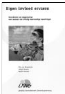
Eigen invloed ervaren

Een eenvoudig boekje van nog geen 50 A5 pagina's met aansprekende foto's en ontroerende stukjes casus. Het hoofdstuk over de Visie begint met: