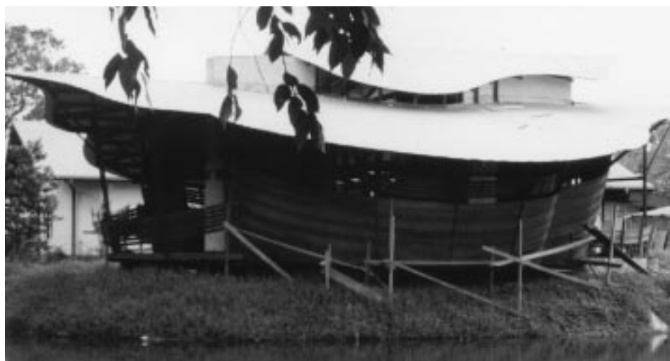
Het nieuwe therapeutisch centrum in Lelydorp.

omdat Matoekoe een uniek plekje is, niet alleen in Suriname, maar in de hele wereld. In een wereld die professioneler, zakelijker en commerciëler wordt en onpersoonlijker dreigt te worden.