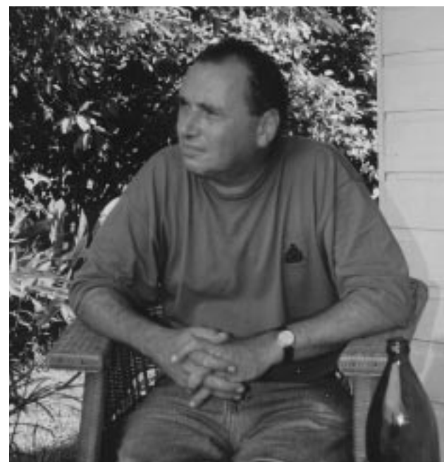
'Ik ben bescheidener geworden'

Heilpedagogie voor in de gevangnissen, voor de drugsverslaafden, voor de zwervers, de uitgestotenen, de verweesden van onze samenlevingen. Als we na heel lang oefenen eindelijk iets beginnen te begrijpen van het wonder mens, van de genade van ontmoeting kan heil-