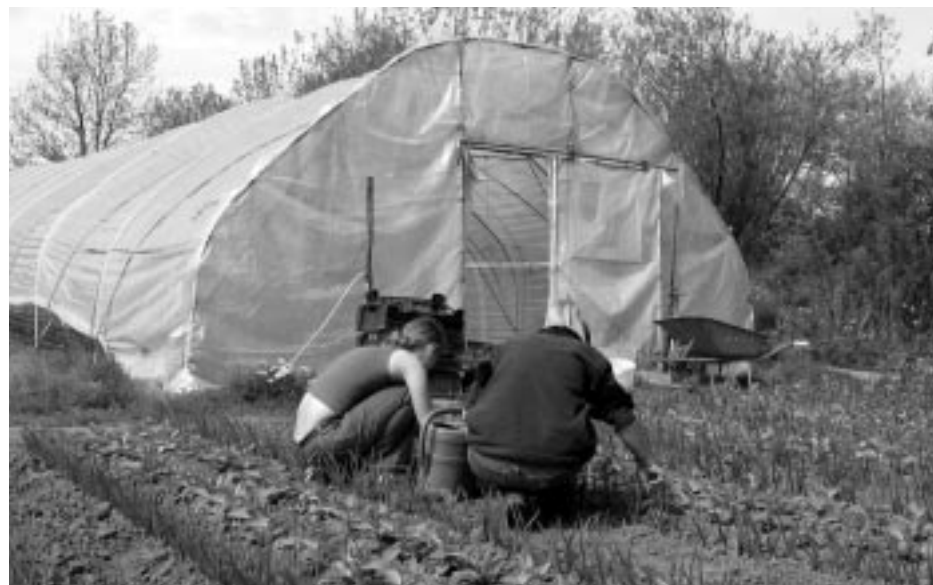
Sociaaltherapeutische instellingen krijgen regelmatig hulpvragen van mensen met een psychiatrische ziektebeelden.

Titurel probeerde een ingang te vinden bij de Bernard Lievegoed Kliniek. De kliniek adviseerde hulp te zoeken in de eigen omgeving.