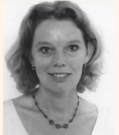
'Ik hoop nooit meer in een burn-out situatie terecht te komen.'

Na mijn studie rechten en voor de geboorte van mijn dochtertje Renske was ik officemanager bij een communicatieadviesbureau in Amsterdam. Een half jaar na de geboorte kreeg ik door een samenloop van omstandigheden een burn-out. Door de verhuizing vlak na de bevalling, problemen met mijn dochtertje na de geboorte (zij was enkele dagen in levensgevaar en moest