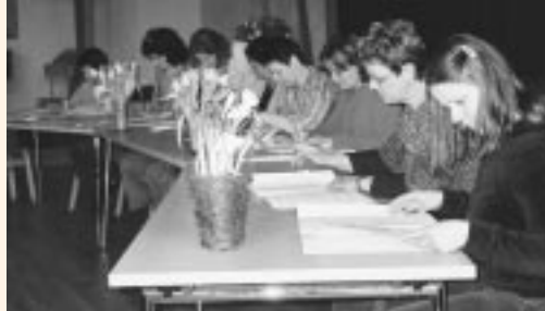
De geslaagden ondertekenen hun getuigschrift

In toenemende mate komen er medewerkers in de antroposofische geïnspireerde zorgverlening en ondersteuning werken die een reguliere beroepsopleiding voor de zorgsector hebben. Zo ontstond er naast onze eigen opleiding heilpedagogie/sociaaltherapie behoefte aan een opleiding tot heilpedagoog en sociaaltherapeut, ook wel therapeutisch begeleider genoemd, die op deze eerdere beroepsopleiding kon aansluiten. Hiertoe werd de inhoud van het Internationale Handboek Opleidingen Heilpedagogie/Sociaaltherapie aan de Nederlandse situatie aangepast. De structuur van de opleiding volgt de antroposofische zorgmethodiek die van vraagstelling, via waarnemen, beeldvorming, en dergelijke tot evalueren loopt.