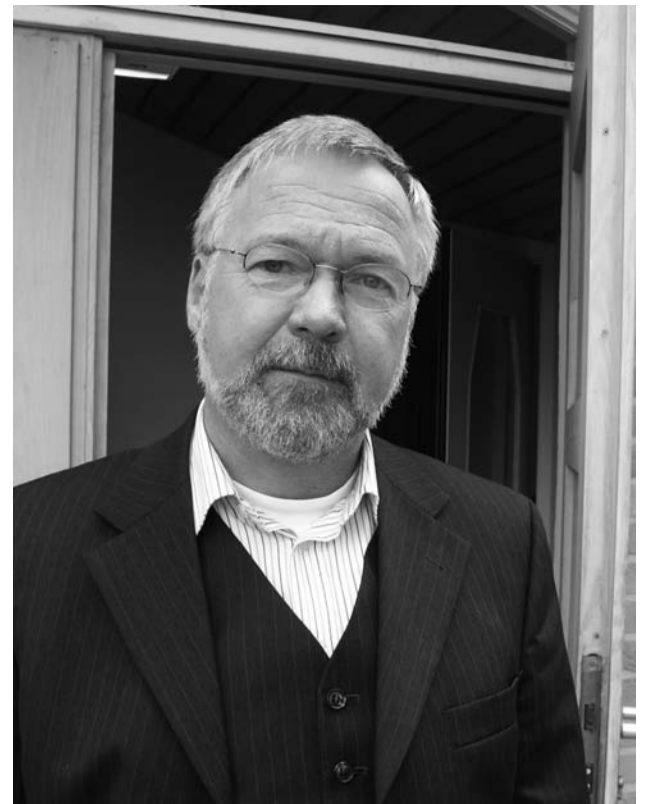
‘Door de gemeenschapsgedachte is er een grote betrokkenheid van de medewerkers’

Toch vindt Benschop dat na vijftig jaar het Camphill-gedachtegoed nog fier overeind staat. “Het heeft alleen een eigentijds jasje gekregen. En dat is nodig, vanwege maatschappelijke ontwikkelingen en zorgontwikkelingen als vraaggestuurde zorg en de modernisering van de AWBZ.” Hij merkt op dat het gemeenschapsideaal de essentie is van de Camphill-gedachte ten opzichte van de overige heilpedagogie. Dat blijft overeind staan en zal volgens hem overeind blijven staan. Om de identiteit levend en eigentijds te houden heeft Christophorus het project Broederschap in het leven geroepen. “Centrale vraag bij dit project was: wat boeit en bindt ons aan Christophorus? In ieder team is daarover gesproken. We hebben stil gestaan bij onze gezamenlijke identiteit en bij gemeenschapszin in deze tijd.”