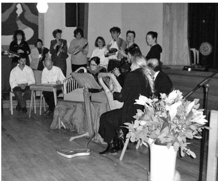
Choroi Ensemble

Daarna volgen de intensieve jaren van steeds verder verdiepende heilpedagogie, van medisch werk en voordrachten in den lande, van zijn promotie en de beproevingen van de Tweede Wereldoorlog. Direct hierna sterft een van zijn kinderen, een verdriet dat hem opent voor hele nieuwe vragen. Die komen hem uit het bedrijfsleven tegemoet en bereiden zijn professoraten in Rotterdam en Enschede en de oprichting van het NPI voor.