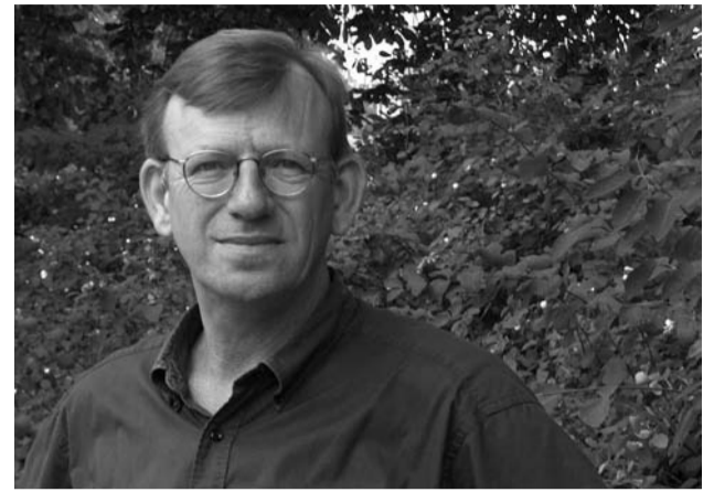
“Wij zijn ergens doorheen gegaan”

Veel mensen met een handicap en hun ouders kiezen heel bewust voor OlmenEs. Dat is bijzonder. Misschien niet in eerste