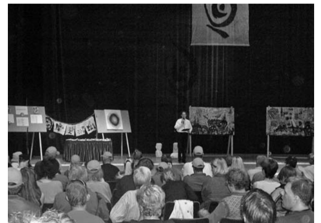
De afsluiting van het congres

Elke zonsopgang en zonsondergang kun je als een drempel zien – en als symbool kregen alle deelnemers een oranje pet die als het ware licht gaf op de plek waar men zich bevond, zodat iedereen in de stad goed zichtbaar bleef. Iedere dag begon met zingen om iedereen voor de ochtendinleiding samen te brengen. Daarna was er koffiepauze waarin nieuwe contacten konden worden gelegd. Elke ontmoeting vraagt van ons dat we over 'de drempel tussen jou en mij' heen stappen – terwijl we ons realiseren hoe verbazingwekkend verschillend wij van elkaar kunnen zijn. Het vergt moed om de ontmoeting te wagen. De taal kan één van de barrières zijn – hoe kan ik contact krijgen met iemand die mijn taal niet spreekt en maar weinig Engels, Duits of Tsjechisch, maar die zo hartelijk naar me glimlacht dat ik het toch maar moet proberen.